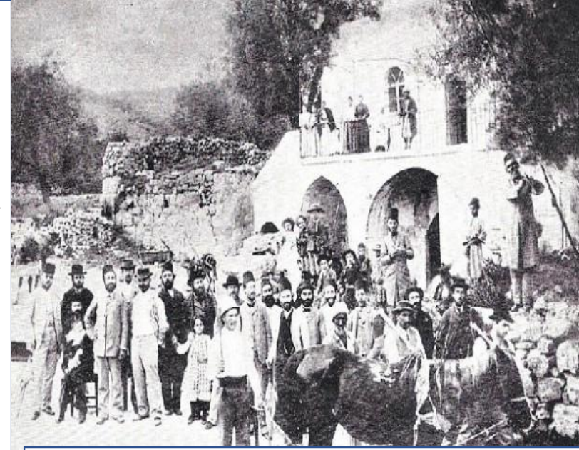
اول دفعة مهاجرة من اليهود جاءت الى فلسطين المحتلة

وزادت الضغوط وتظاهرت وتضافرت وتدخلت الدول الأوروبية بثقلها الدبلوماسي وبعد إلحاح اليهود عليها، فأصدرت الحكومة العثمانية تعليمات جديدة سمحت لليهود بسكن القدس لمدة شهر واحد فقط. في 1305 هـ/1888م وبعد مرور ثلاثة أعوام، تدخلت بريطانيا وبذلت جهودها للتخفيف من شرط الإقامة الزمني، فرضخ السلطان لتلك الضغوط وخفف المدة إلى ثلاثة أشهر. واتخذ الباب العالي قراراً بتحويل سنجق القدس التابع لوالي دمشق إلى متصرفية حيث أن المتصرفيات تتبع الباب العالي مباشرة وذلك لتشديد المراقبة. وأرسل أعيان مدينة القدس إلى السلطان شكوى يطلبون فيها إجراء فعال يمنع دخول اليهود ويمنعهم من شراء الأراضي، فأصدر فرماناً في (10 جمادى الآخرة 1310 هـ/30 ديسمبر 1892م) يحرم فيه بيع الأراضي الحكومية لليهود حتى لو كانوا عثمانيين من رعايا الدولة العثمانية ولعل ذلك يكشف لنا عن مدى الحذر والحيلة التي درجت عليها السلطنة العثمانية ازاء مفعول استراتيجية الصهاينة ومنذ فترة مبكرة في 28 يونيو 1882م فقد ارسل السلطان خطابا يوجه متصرف القدس بمنع اليهود من شراء اراض كما سنرى في الشريحة التالية