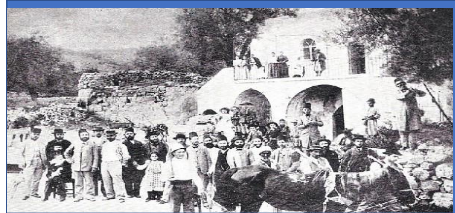
اول دفعة مهاجرة من اليهود جاءت الى فلسطين المحتلة

الصهيونية والدبلوماسية والماسونية بحزم. وقوة ارادة انظروا الى حالتهم في هذه الصور مشردين اصبحوا بقدره قادر اصحاب حق واهل البلاد الاصليين تشريدتهم من اجل عيون هؤلاء الذين لا وطن لهم