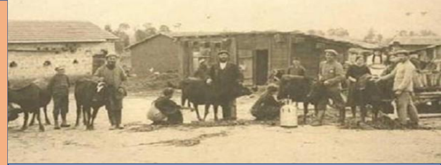
الهجرات الاولى في فلسطين في شكل تسلل محدود